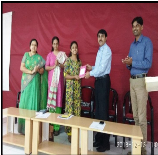
While greeting to resource person.