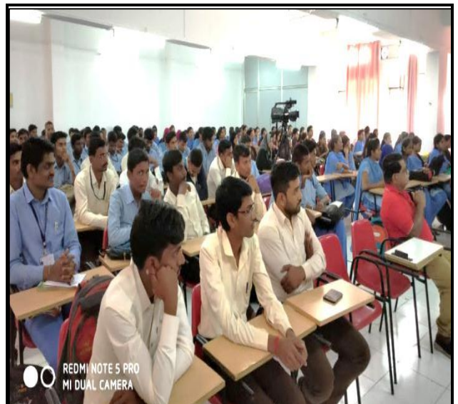
Students listening carefully.